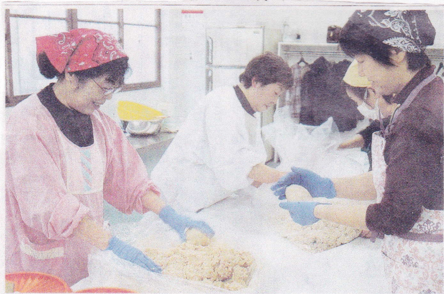
みそを造る参加者たち